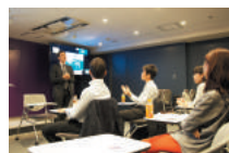
講師陣はビジネストレーナー、国際広報パーソン、映像作家、英文ライターなど