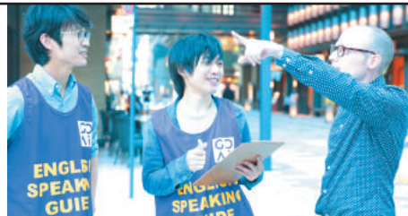
授業以外のフォローアップ体制にも注力。受講生・修了生が参加できる語学ボランティアでは、学んだスキルをすぐに発揮できる

〒103-0021 東京都中央区日本橋本町3-2-4 共同ビル(日銀前)2F/3F TEL 03-3517-5002 http://www.jvtcademy.com